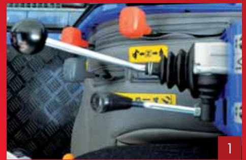
Die Joystick-Kommandozentrale zur kompletten Hydrauliksteuerung.