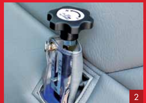
Schnitthöhen-Einstellung des Mähwerks innen in der Kabine.

Optional können Ölmotorenantriebe am Traktor vorn und hinten betrieben werden. Die Ölmenge kann stufenlos vom Fahrersitz geregelt werden.